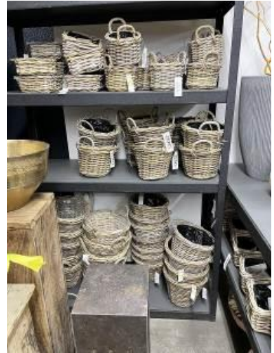
可愛い資材もそろっています