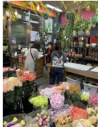
看板娘達👧 ウェイトレス どの業種でも接客はとても大事 ですね しっかりコミュニケーションを とって頑張りましょう