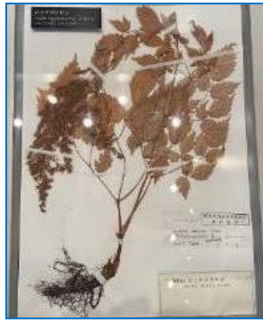
フジアカショウマ