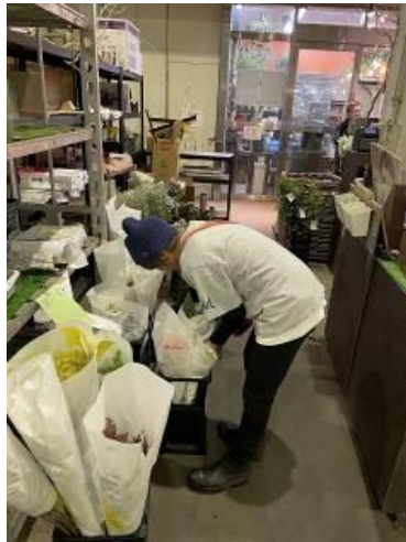
店長さん、しっかり花 を見ています👁️