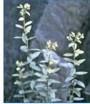
カワラウスユキソウ