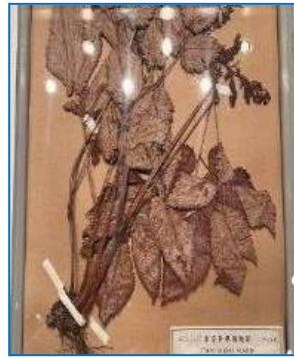
ハチジョウショウマ