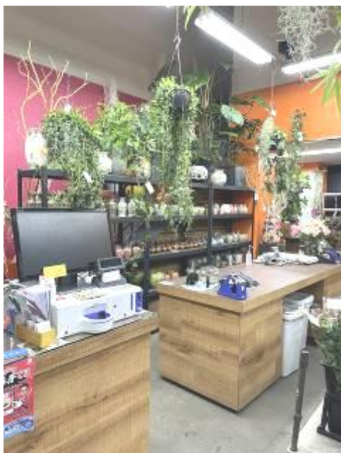
お会計はこちら・・・