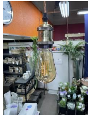
電球もおしゃれなんです💡