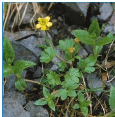
クモマキンポウゲ