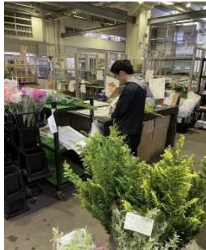
若き次世代エース👧 ボーイさん&ボディガード