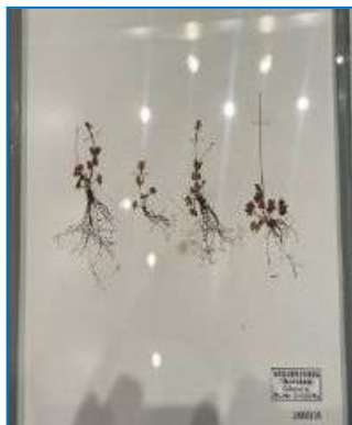
クモマキンポウゲ

高山植物の多くは、氷河期に南下してきた寒冷地の植物が、その後の間氷期に高山に取り残されたもので、多様な分布パターンは、種ごとに異なる背景が秘められている事を示している。