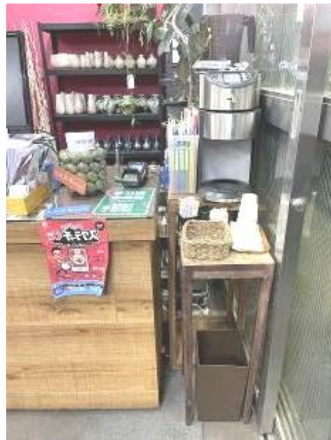
コーヒーもあります☕