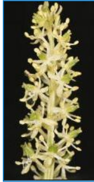
エゾウスユキソウ