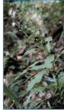
ビッチュウアザミ