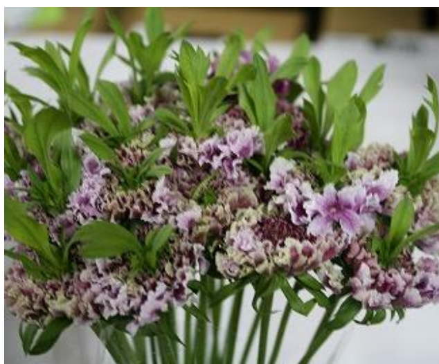
【スイートチェリースクープ】 千葉県 青木園芸