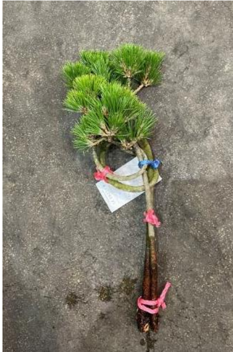
お菊の松 ミゾグチファーム