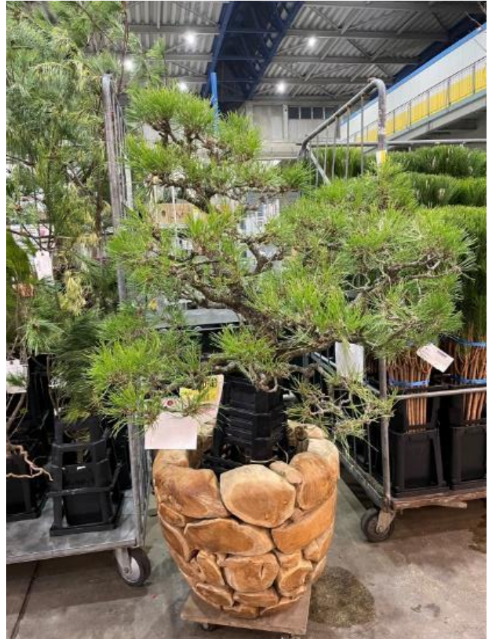
老松 茨城県 ミゾグチファーム 迫力あります。