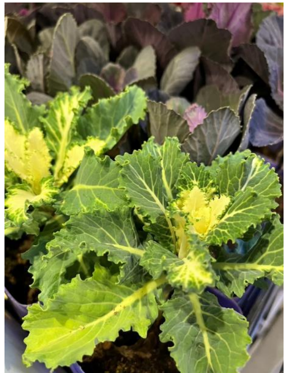
Tsun tsun tsun