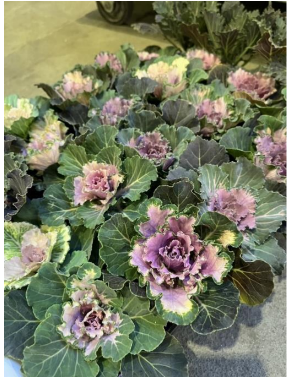
Café time collection