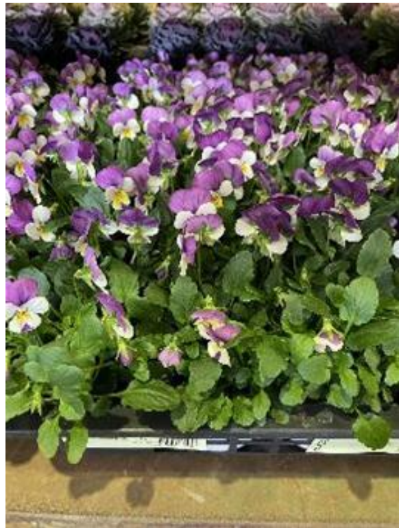
千葉県 ビオラ ペルシャピンク ポット