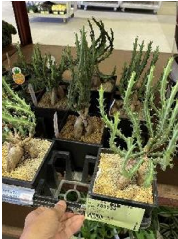
愛知県 サボテン多肉 ユーフォルビア 5寸