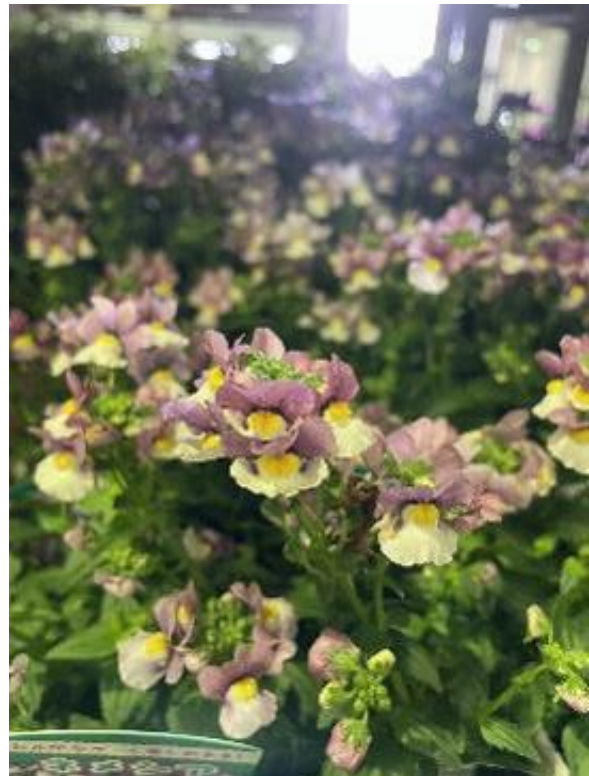
愛知県 ネメシア プリティープリンス ポット