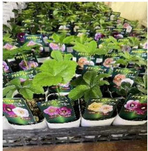
栃木県 クリスマスローズ MIX ポット