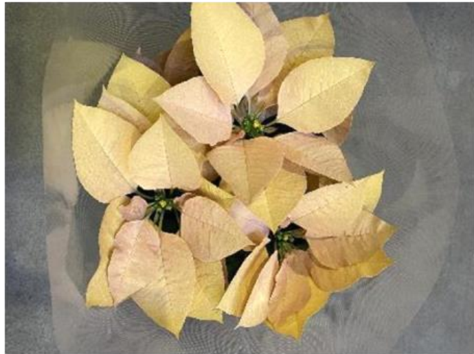
静岡東部 ポインセチア・ゴールド6寸