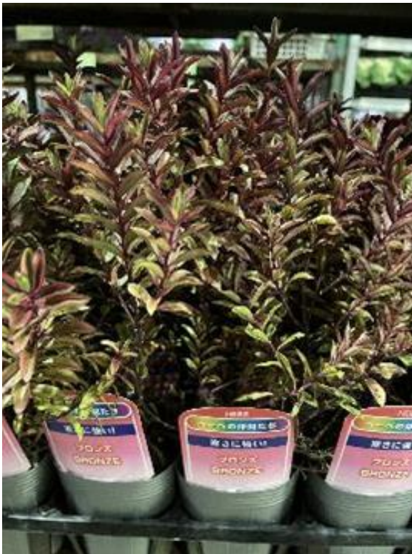
長野県 ヘーベ ポット 寒さに強い！