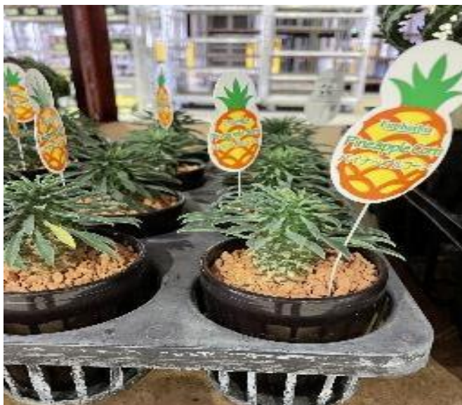
愛知県 パイナップルコーン🍍