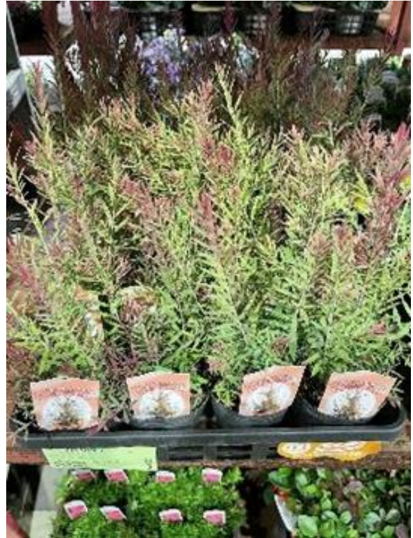
栃木県 クリスマスローズ ウインターベル 福岡県 メラレウカ マウンテンファイヤー ポット