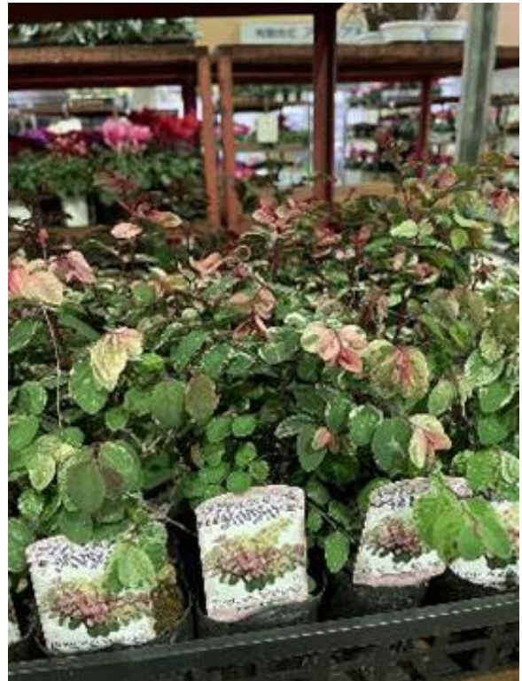
千葉県 ヨウシュコバンノキ ポット