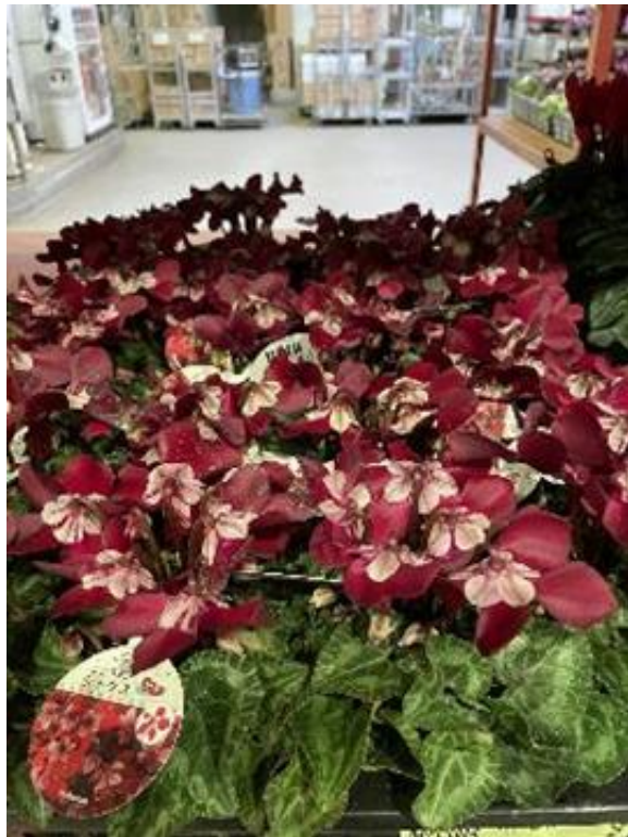
千葉県 ミニシクラメン ジックス3寸 素敵な色合い！