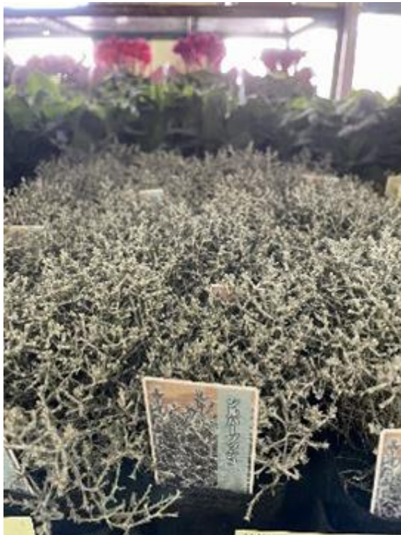
群馬県 シルバーブッシュ ポット