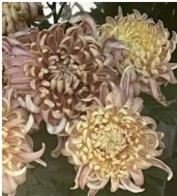
セイマノアサーモン