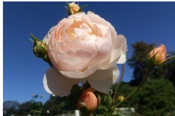
ザ・シェパードス 中輪の深いオープンカップの花