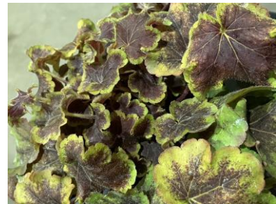
ソーラーエクリプス