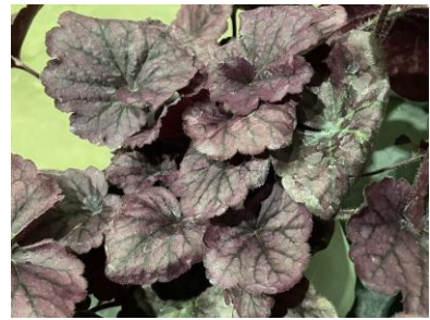
ノーザンエクスポージャー