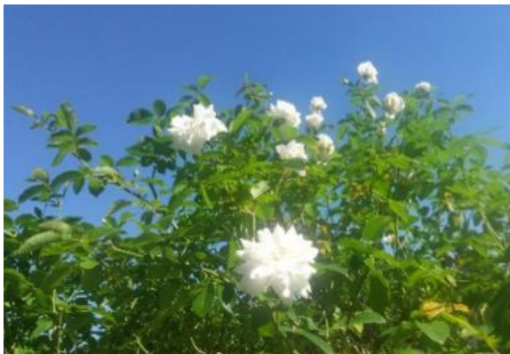
アイスバーグ 丸弁半八重咲の白バラ