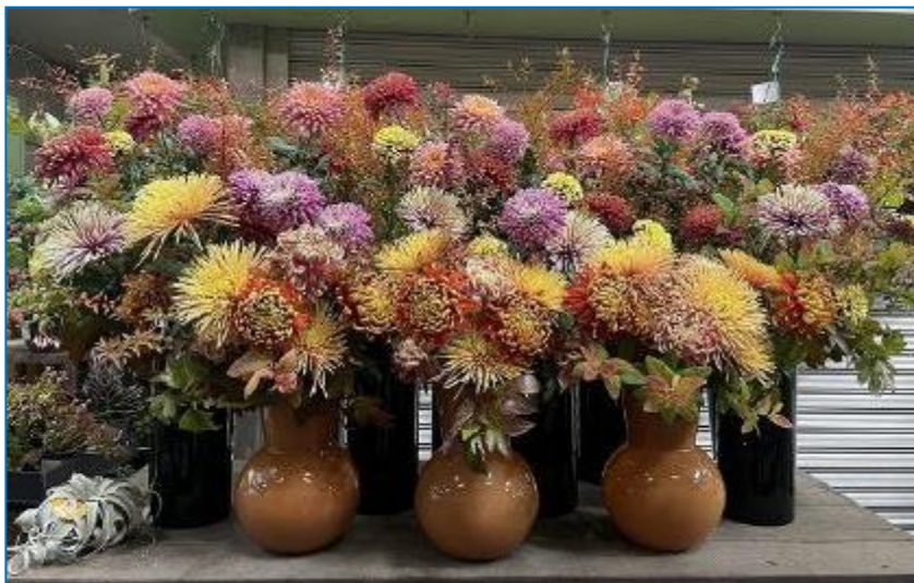
【店頭のディスプレイ】