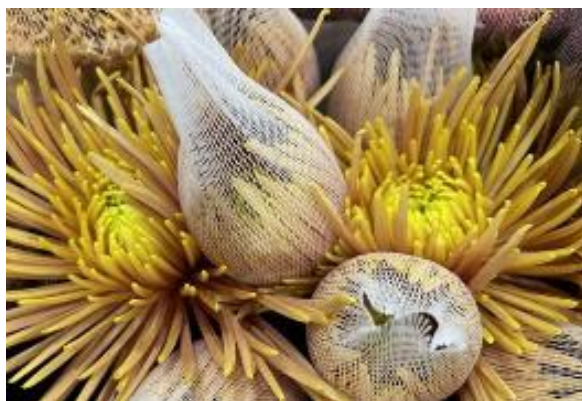
カプリオールブロンズ