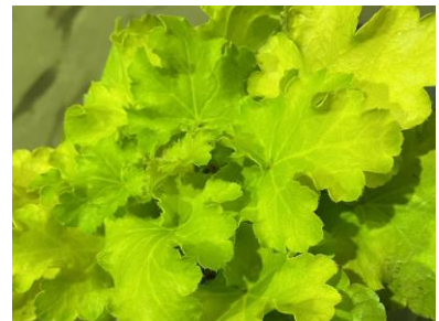
レモンシュプリーム