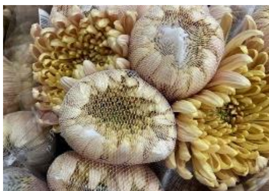
アリヨンカサーモン