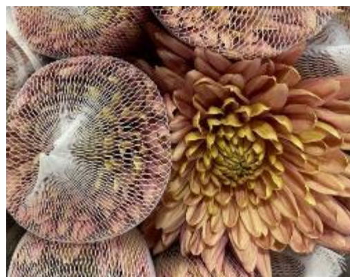
バルティカサーモン