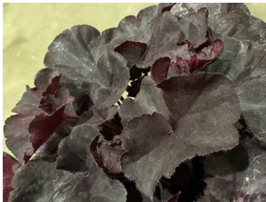
ブラックフォレストケーキ