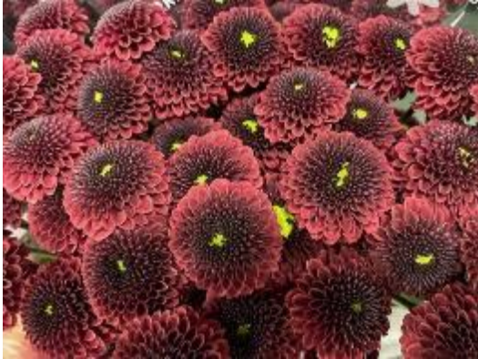
バーベッタレッド