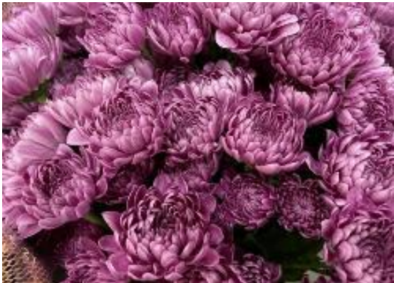
セイヌーボーチェリーピンク