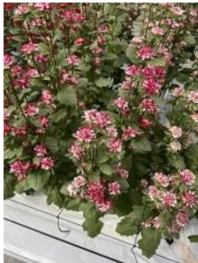
アスター ココットマーブルレッド