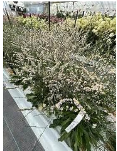
リモニューム ベイビーテール