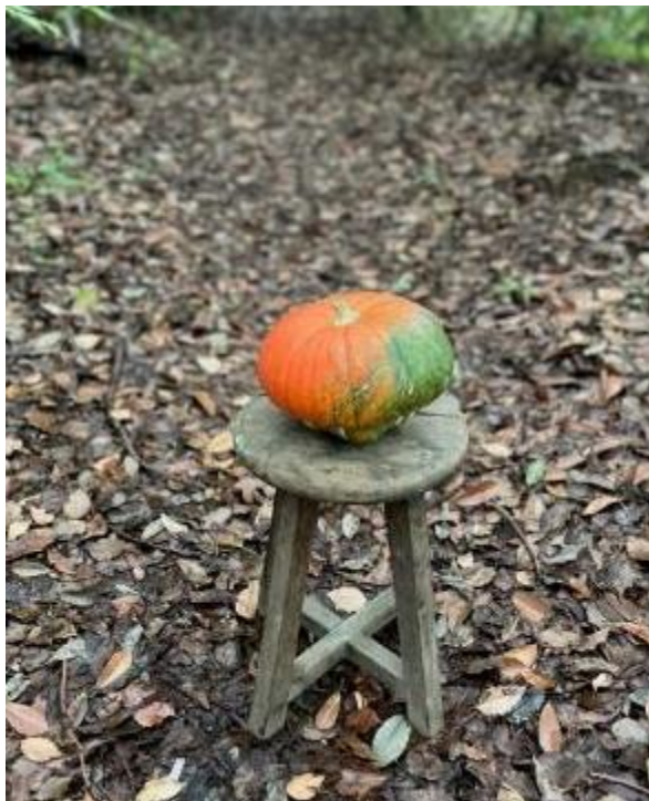
カボチャ タークスターバン 北海道/JA 北空知広域