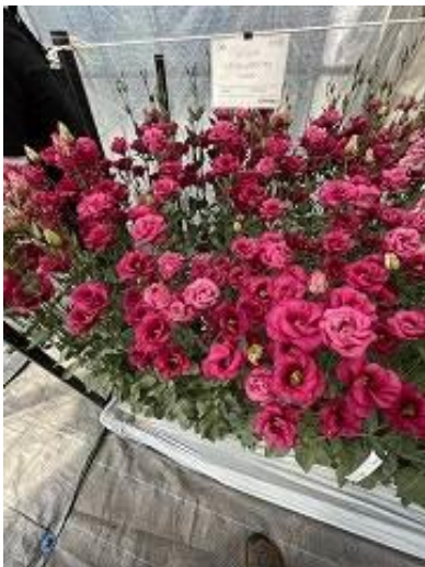
トルコキキョウ レディロツソ