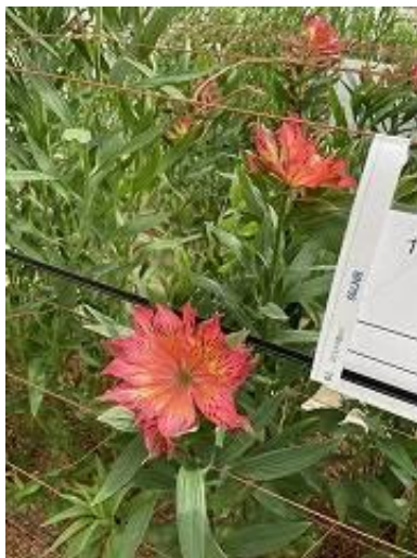
アストロノバの開発品種