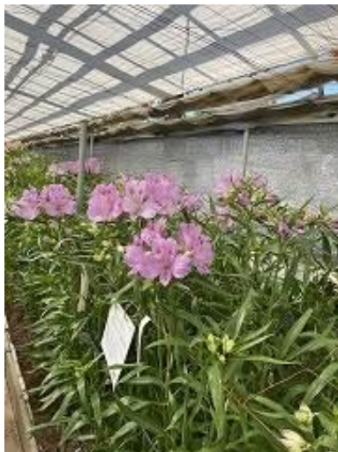
フィオレンティーナ