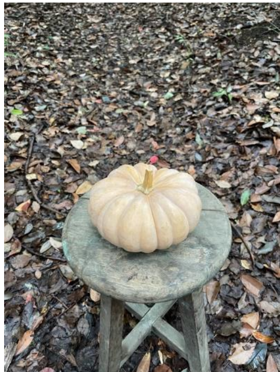
ジェームスクラウン カボチャ 埼玉県/雑花