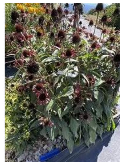
エキナセアグリーンチョコ