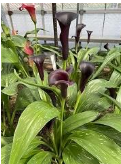
カラブラックメタル