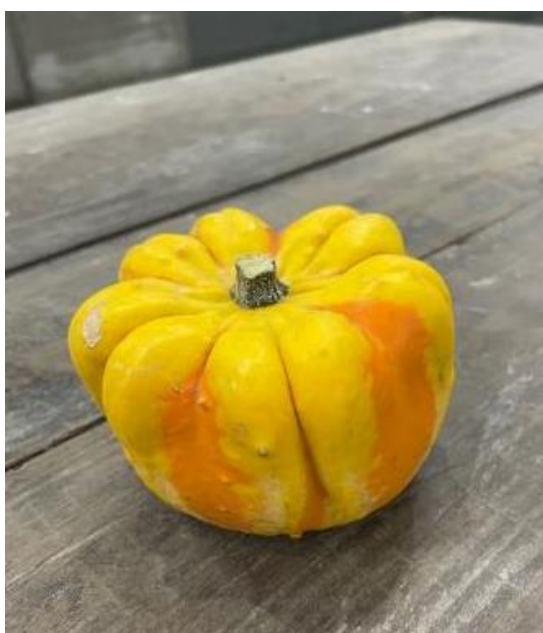
スターMIX オレンジ カボチャ 北海道/和寒町)北ひびき農協

渋谷で騒ぐのもハロウィンの風物詩になっていますが新たなハロウィンの過ごし方を見つける時期だなと思いました。 ハロウィンはお祭りなので騒いでもいいと思いますが自分の為に騒ぐのか、誰かの為に騒ぐのか、渋谷へ向かう若人達の有意義なハロウィンを願ひまして今週のホットニュースを終わらせていただきます。