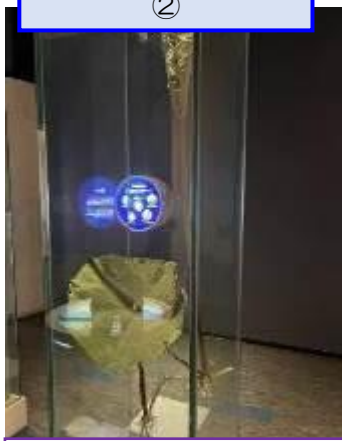
巻葉が成長する過程 ②