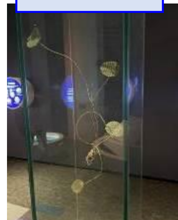
地下茎が出てくる