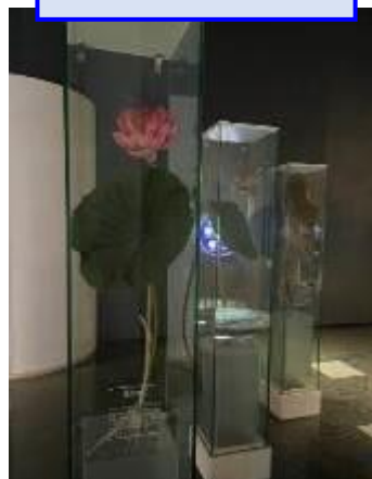
花が咲くまでの様子