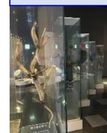
花が枯れるまでの様子