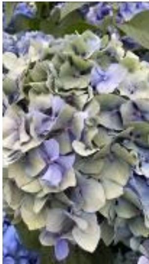
ピソパ-祢ブル-アンティーク