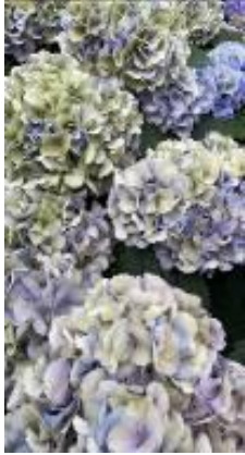
ブリックアンティーク