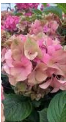
ガーネットピソクアンティーク