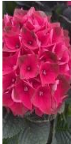
クリムゾ ソレット