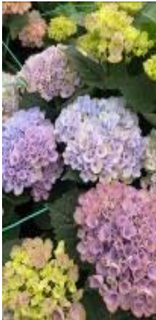
レポ リューション