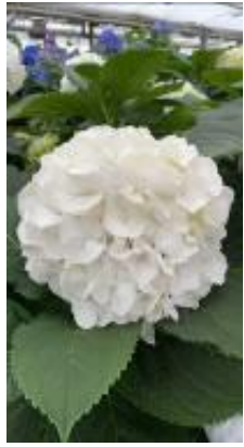
ホワイトバレーナ