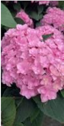
ルキノールピソク

【品種】 ※アンティーク系の色味は訪問した時の感じなので、いつもドンピシャでこの色味というわけではありません！！