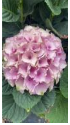
マジ カルオーシャン