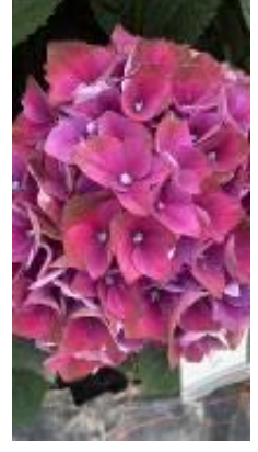
クリムゾンパープル