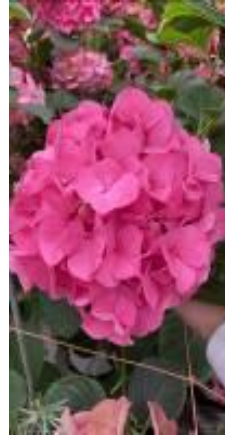
マジ カカーネット