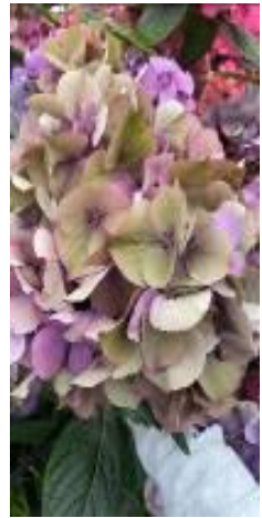
ガ-ネットパ-フルアンティーク