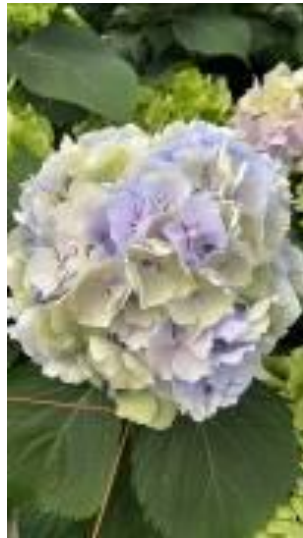
パレアンティーク

今回はじめてアキバナーセリーさんにお邪魔させてもらい社長・会長とお会いできてたくさん話をさせていただきましたが、お二方とも『気持ちいい人!』でした。しっかりとブシない意思を持っていて、かといって頑固にならず素直で柔軟な対応ができ、そして半端なく酒を飲む笑。圃場でも飲み屋でも蕎麦屋でもどこの誰に対しても同じ対応の出来る裏表のないオトコとしてもカッコいいおふたりでした。