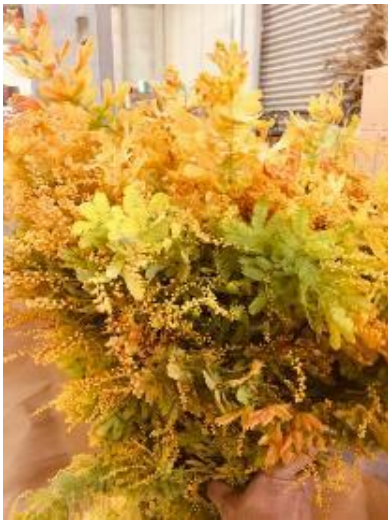
ミモザ ツトム

“含羞草(オジギソウ)” 実はオジギソウとは属が違いますが、葉が似ていたために誤ってつけられたとの説です。