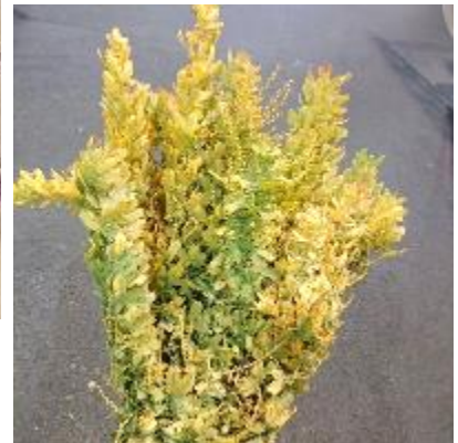
ミモザ オーレア(ありだ吉備営農)