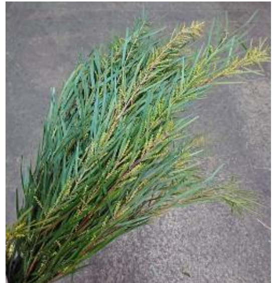
(写真右→) ミモザ フロリバンダ (ありだ吉備営農)