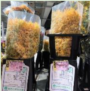
(写真上) 入荷しました！オーレア(JA大井川産)