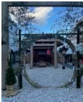
小石川大神宮(文京区)