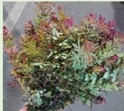
(写真上) レッドクリスタル (ありだ吉備営農)