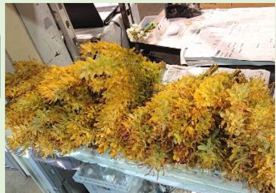
(写真上) 出荷を待つオーレア(JA大井川産)