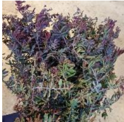
ミモザ パープレア(とぴあ浜松産)