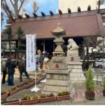
高円寺氷川神社（杉並区） 日本唯一の気象神社 (◎_◎;)）