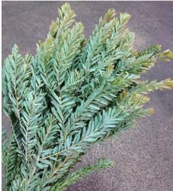
(←写真左) ミモザ ブルーブッシュ (遠藤農園 茨城)