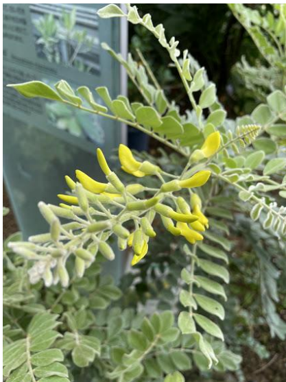
アメリカハナグサ マメ科