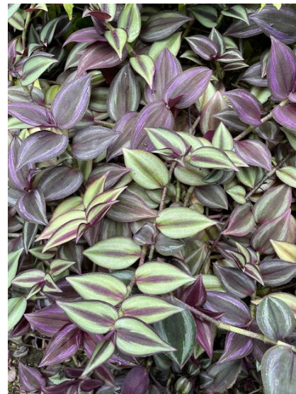
イソフジ ピンクジャスミン クワ科