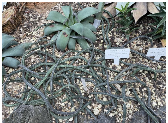
テツシャクジョウ キク科