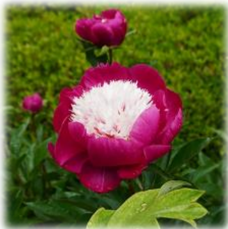
↑『ウイニングオブザモーニング』