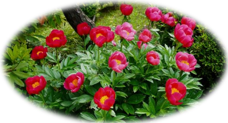
『スカーレットオハラ』