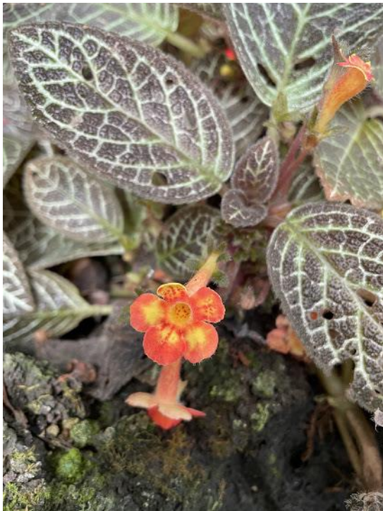
ベニハエギリ イワタバコ科 中央アメリカ