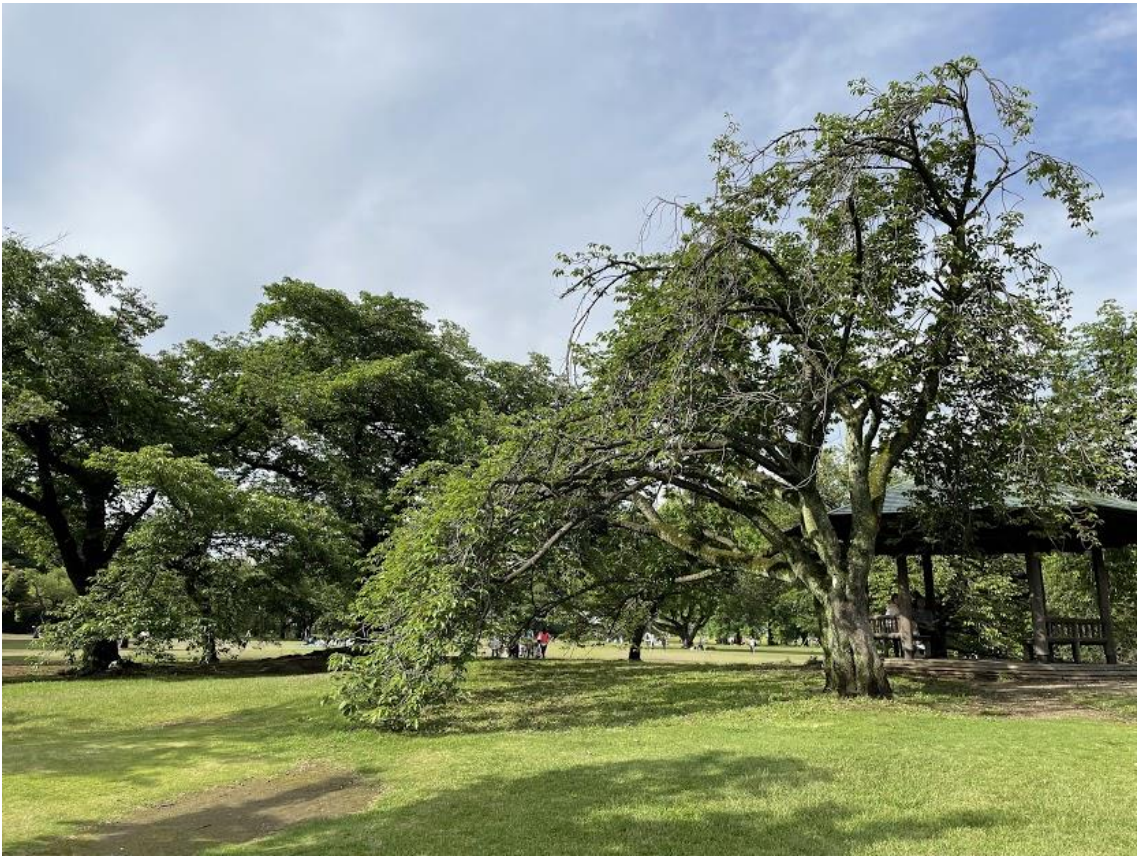
大田店 チャンロッキ