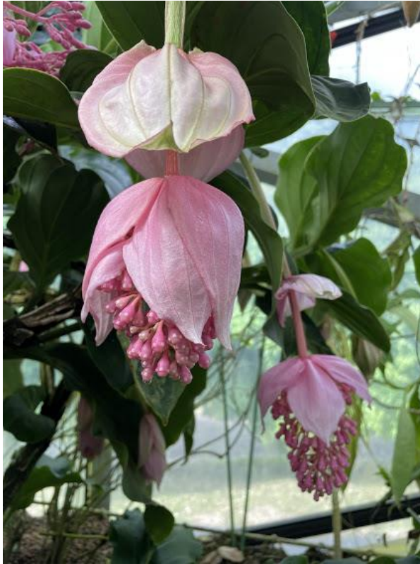
メディニラ・マグニフィカ