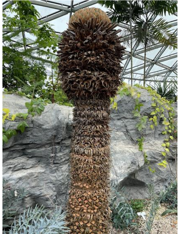
シャムソテツ ソテツ科