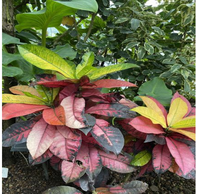
クロトン アケボノ→ トウダイグサ科 クロトンの広葉系園芸品種 葉に赤や黄色の斑が大きく入ります