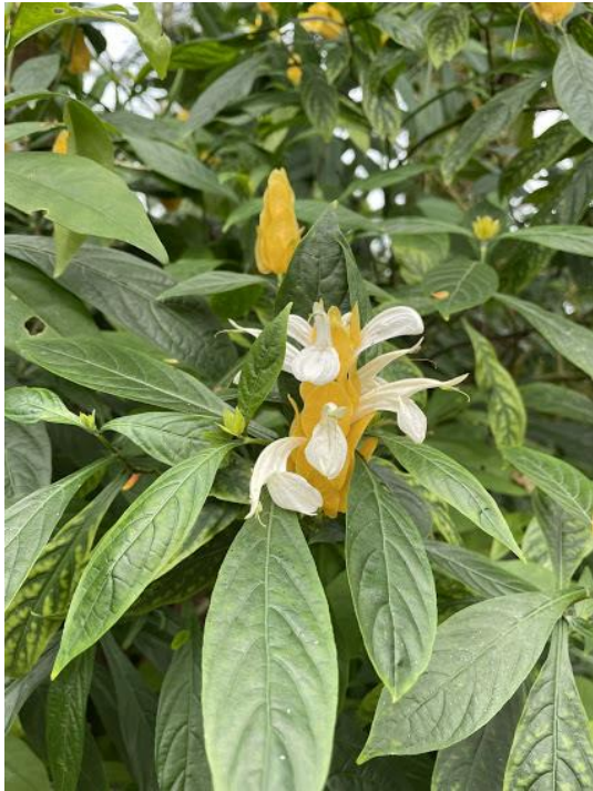
パキスタキス・ルテア