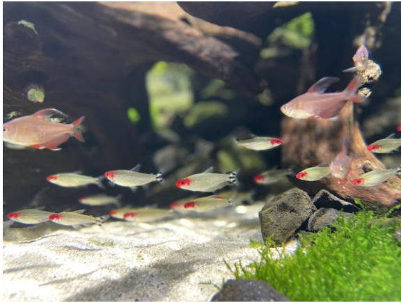
↑最高のアクアリウムで生活している子たち。