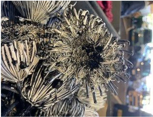
ドライ レースフラワーの黒とピンク