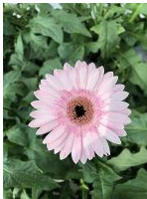
マルディーニ 今回の個人的な注文株