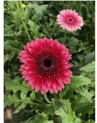
レンブランド マイフェイバリット ガーベラのひとつ