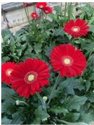
リンゴケーキ アップルケーキの後継 明るめ鮮やかレッド