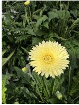
ミカツキ 花弁がシッカリしています マリブの代わりはこれ