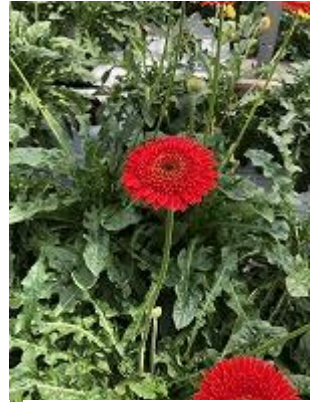
オレンジビーナス 淡めオレンジ ボリュームミーです