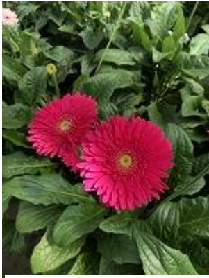
アサイーケーキ 最近少し減ってきましたが 濃ピンクで人気