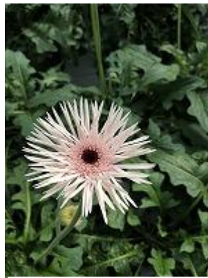
ファンシースパーダ