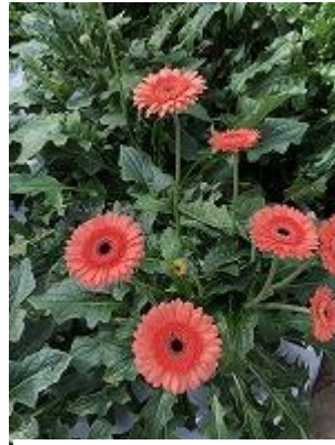
クキーアンドクリーム 根強い人気品種