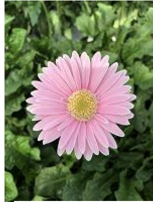
ピラティスローズ ピラティスより少し濃い目 優しいピンク