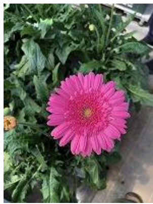
キラズケーキ ライラック系なピンク キラズはさくらんぼの意 明るめ鮮やかレッド