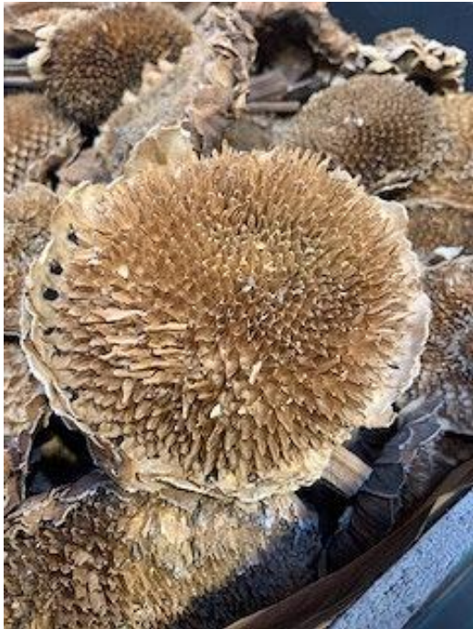
こちらは、ドライ ヒマワリ